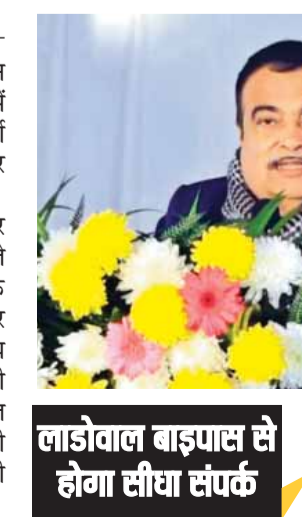
लाडोवाल बाइपास से होगा सीधा संपर्क

एजेसी नोशियारपुर। पंजाब के होशियारपुर में केंद्रीय सड़क मंत्री ने किया सुधार संबंधी बड़ा ऐलान। एजेसी नोशियारपुर। केंद्रीय सड़क परिवहन मंत्री नितिन गडकरी ने पंजाब के होशियारपुर में 4,000 करोड़ की 29 राष्ट्रीय राजमार्ग परियोजनाओं का उद्घाटन और शिलान्यास किया। गडकरी ने सोशल मीडिया हैंडल पर भी एक पोस्ट में जानकारी साझा करते हुए कहा कि इन परियोजनाओं के कार्यान्वयन से बुनियादी ढांचे में सुधार होगा, जिससे कार्यान्वयन क्षेत्र का समग्र आर्थिक विकास होगा और आबादी की जीवन गुणवत्ता में सुधार होगा। यातायात की निबंध और मुक्त आवाजाही होगी जिससे माल ढुलाई की दक्षता में भी सुधार होगा।