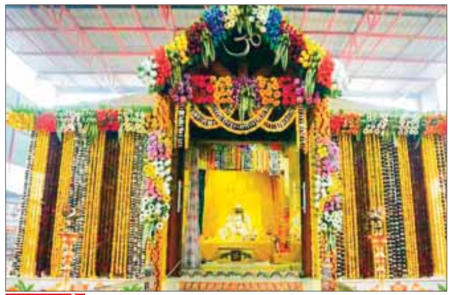
इस तरह की जा रही नव्य सजावट

अयोध्या। श्री राम जन्मभूमि मंदिर के लिए 108 फीट लंबी अगवर्ती लेकर एक ट्रक गुरुवार को अयोध्या में प्रतिष्ठा समारोह के लिए मंदिर पहुंच रहा।