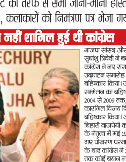
भाजपा ने इस पर इतिहास की याद दिलाई

आखिरकार कांग्रेस ने अपना रुख साफ किया भाजपा सांसद और प्रवक्ता सुधांशु त्रिवेदी ने बताया कि कांग्रेस ने नए संसद भवन के उद्घाटन समारोह का बहिष्कार किया। जी20 शिखर सम्मेलन का बहिष्कार किया। 2004 से 2009 तक, कांग्रेस ने कारगिल विजय दिवस का बहिष्कार किया। अटल बिहारी वाजपेयी की सरकार के नेतृत्व में मई 1998 में किए गए पंचरक्षण परमाणु परीक्षण के बाद कांग्रेस ने 10 दिनों तक कोई बयान नहीं दिया।