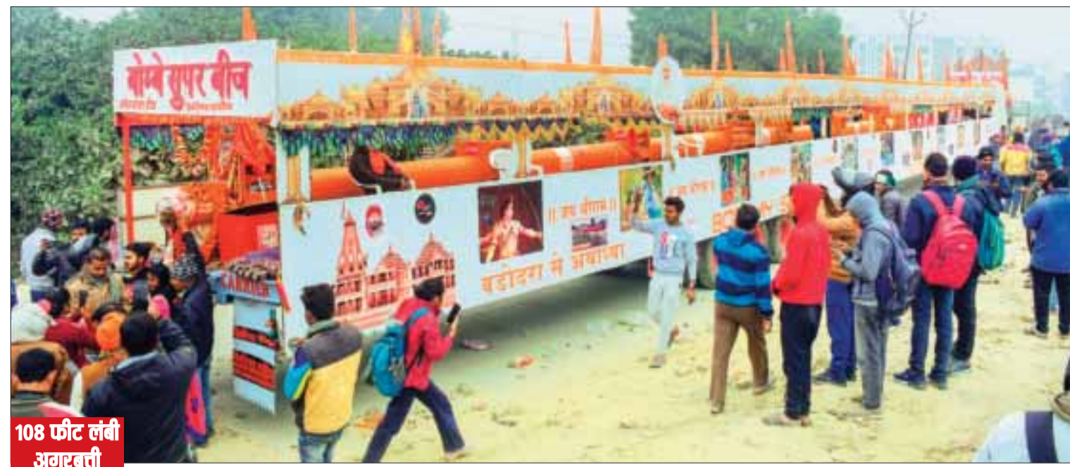
108 फीट लंबी अगवर्ती अयोध्या पहुंची

अयोध्या। श्री राम जन्मभूमि मंदिर के लिए 108 फीट लंबी अगवर्ती लेकर एक ट्रक गुरुवार को अयोध्या में प्रतिष्ठा समारोह के लिए मंदिर पहुंच रहा।